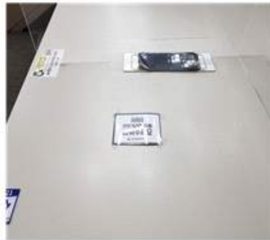
[좌석간 거리두기 안내]