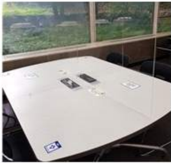
[비밀차단 아크릴 칸막이]