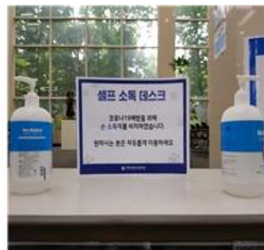
[셀프 소독 데스크]