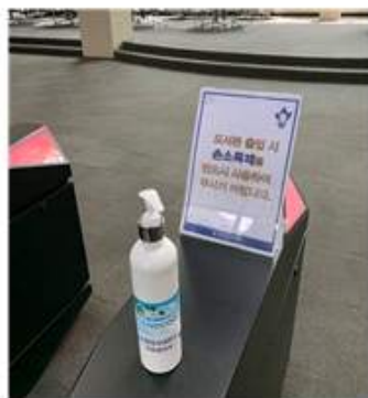
[출입구 손소독제 비치]